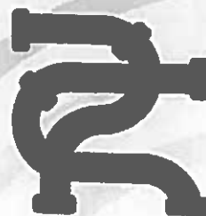
TABELA DE TARIFAS E PREÇOS 2022